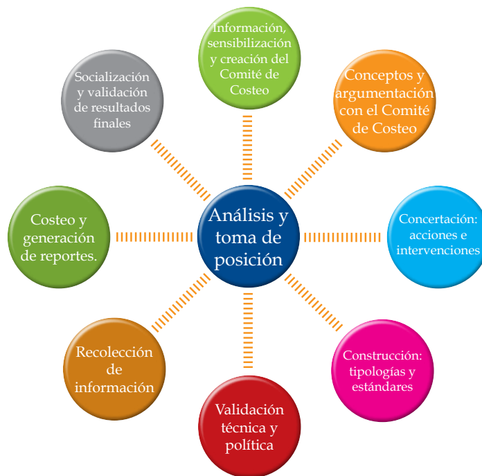
Gráfico N° 1 Ruta Crítica del Proceso de Costeo de Medidas de Igualdad (PCMI)

Fuente: Fundación Colectivo Cabildeo con el apoyo de ONU Mujeres, 2013.